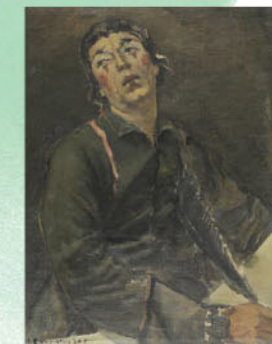
Γιάννης Σπυρόπουλος, "Προσωπογραφία Διονύση Παπαγιαννόπουλου", 1946 (πηγή: www.nationalgallery.gr)